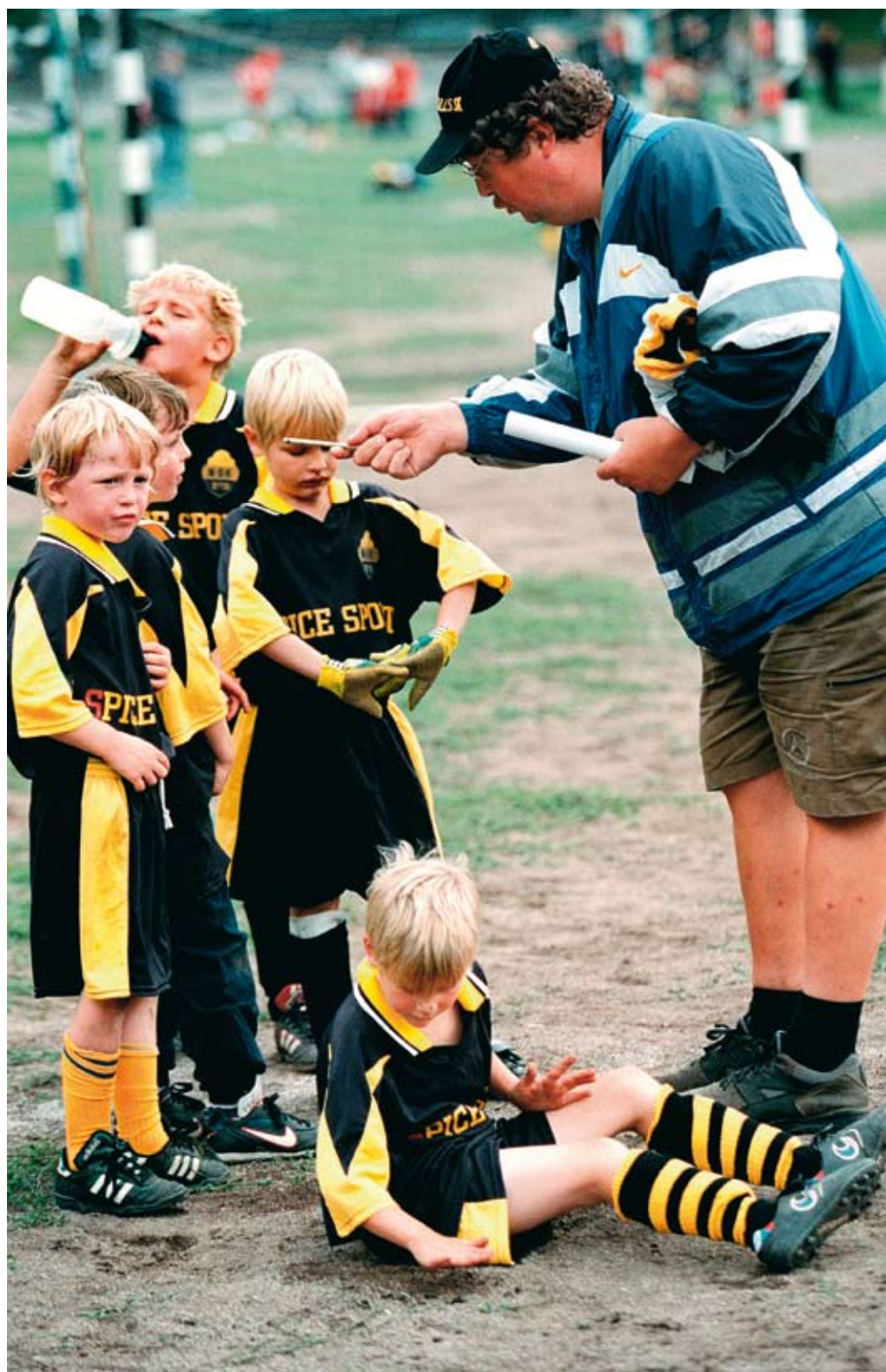
Författarna analyserar i vilken utsträckning som ideella idrottsledare utgör frivilligt socialt arbete i dagens samhälle.

I den andra delstudien analyseras hur Riksidrottsförbundet hanterar sin dubbla roll som folkrörelse och idrottsmyndighet. Här är utgångspunkten att Riksidrottsförbundets ledande roll i svensk idrott innefattar en målkonflikt. Å ena sidan är RF uppbyggd efter traditionella föreningsdemokratiska principer där medlemmar i lokala klubbar knyts samman i regionala och nationella förbund under en gemensam riksledning. Av detta följer att RF:s ledning ytterst har till uppgift att företräda