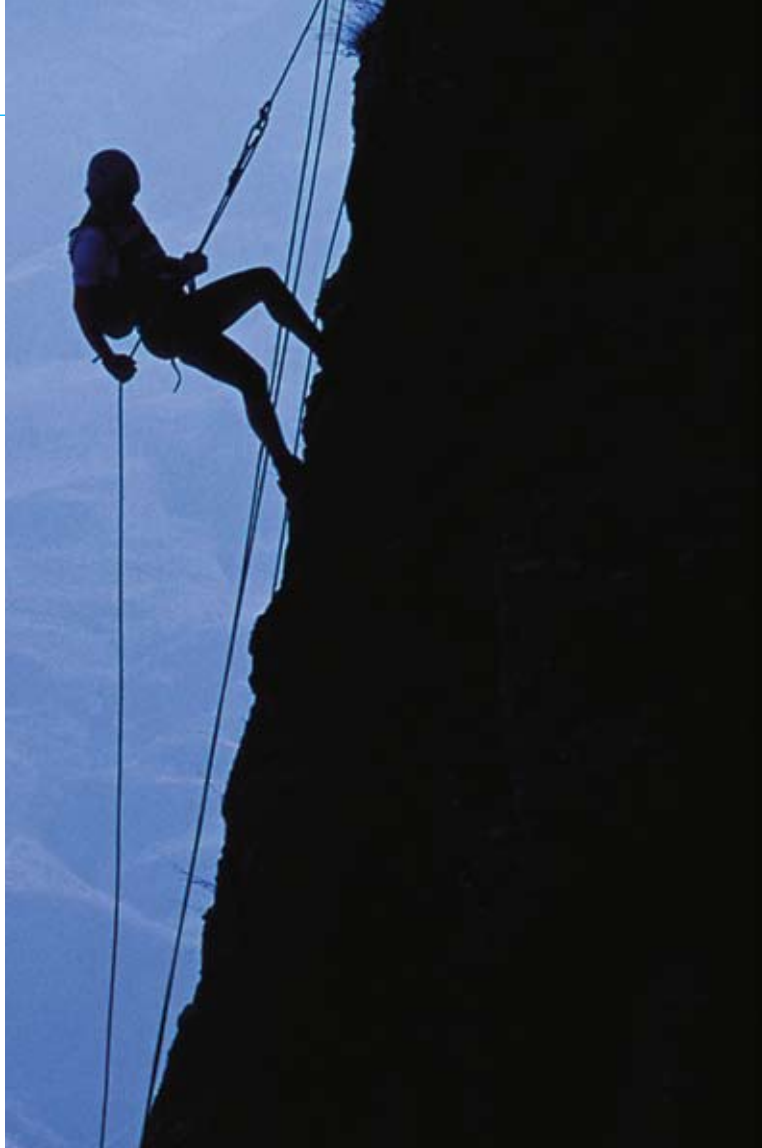
Exempel på grenar som kan ingå i multisport (Adventure Racing).

cykelbelastning. När arbetet fortskred fortsatte VO_2 på den relativt lätta belastningen att stiga, totalt med uppåt 15 %, medan HF sjönk! (Mattsson och medarbetare, submitted manuscript ) Således steg syrepulsen under hela loppet, och kroppen tog alltså upp mer syre per hjärtslag i slutet av arbetet,