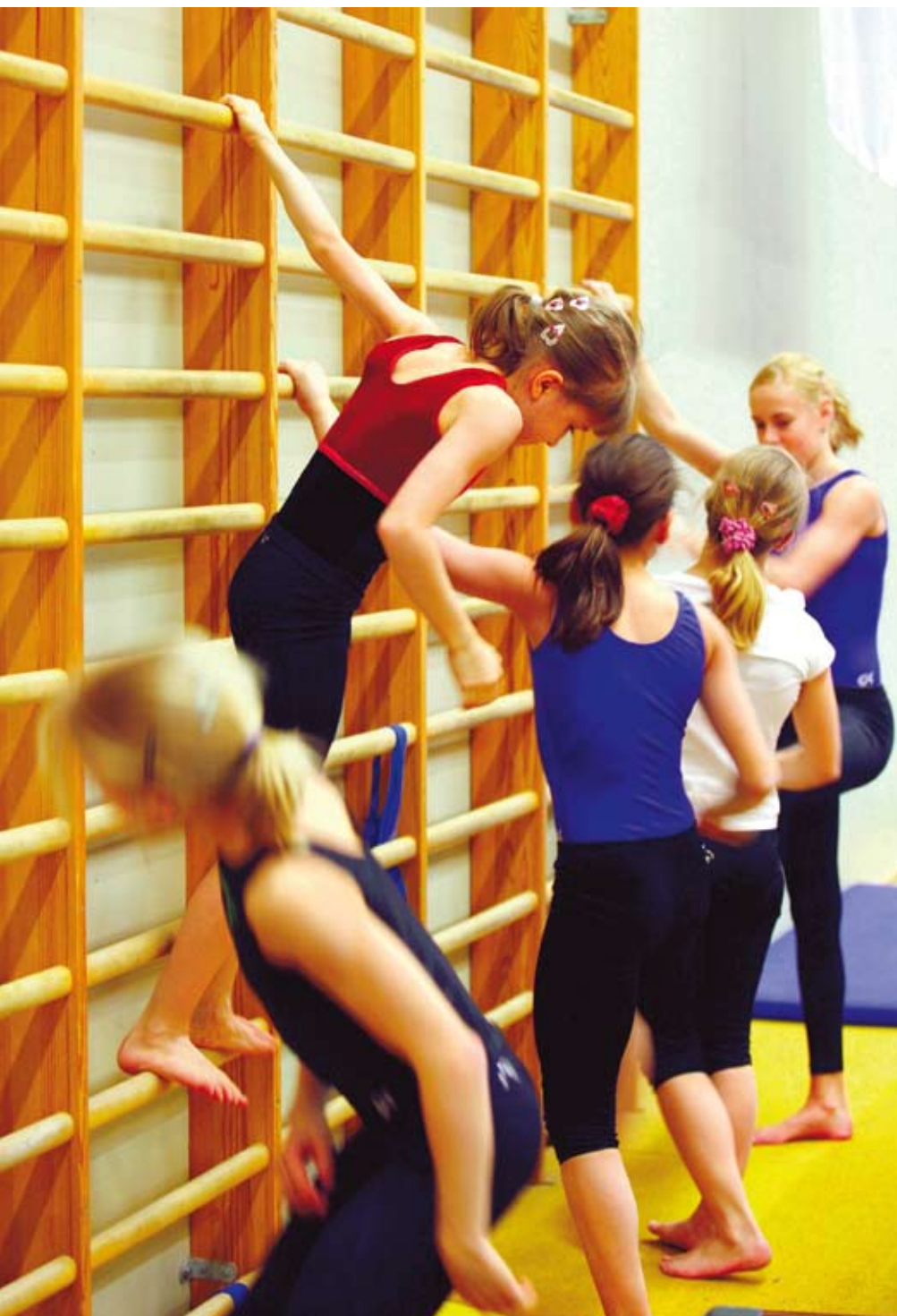
Ett av syftena med Handslaget är att få med flickorna. Viktigt är att satsningen inte blir ett tillfällig jippo utan får en fortsättning.

Samtalen bandades och transkriberades ordagrant inför bearbetningen. Vid urval och tolkningar har hänsyn tagits till kontexten – d.v.s. vad som sagts före och efter de valda citaten (Kvale, 1997).