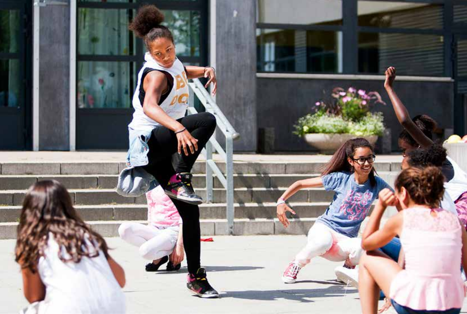
Streetdance på Möllevångsskolan i Malmö.

informella, den kommersiella och den offentliga sektorn överskreds. Gemensamt för dessa projekt var att idrotten användes som medel för både social utveckling och utveckling av den egna verksamheten (3).